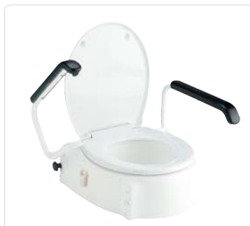
Toilettensitzerhöhung mit Armlehnen; höhenverstellbar