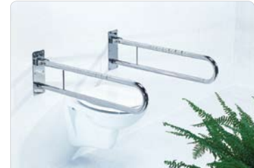
Stützklappgriff für Waschbecken und Toilette