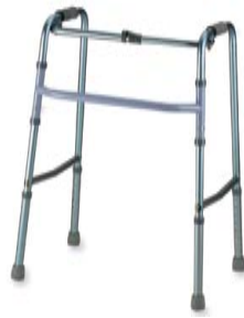
Gehgestell starr / beweglich