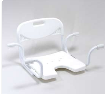
Badewannensitz mit Rückenlehne u. Hygieneausschnitt