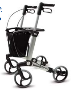
Rollator leicht (7,1 kg Gewicht)