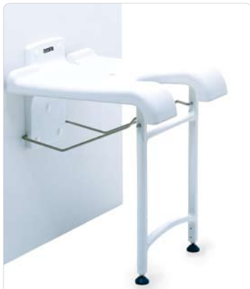
Duschklappsitz an der Wand montiert