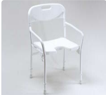
Duschstuhl mit Rückenlehne u. Hygieneausschnitt