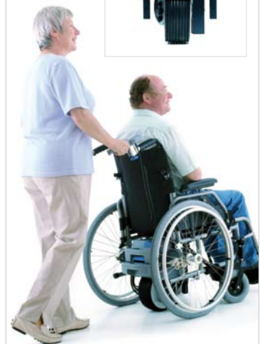
Brems- und Schiebehilfe