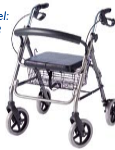
Rollator leicht (7,5 kg Gewicht)